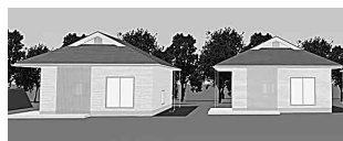
儀式のできる家 親族専用の家