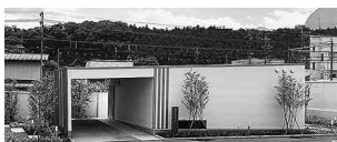
儀式のできる家 親族専用の家