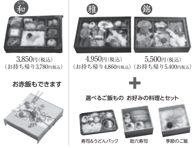
3,850円(税込) (お持ち帰り3,780円税込) 4,950円(税込) (お持ち帰り4,860円税込) 5,500円(税込) (お持ち帰り5,400円税込) お赤飯もできます 選べるご飯もの お好みの料理とセット 寿司&うどんパック 助六寿司 季節のご飯

あたたかご膳いろいろ いつでもどこでもあたたかく お届けもできます(8ヶ以上) お持ち帰りにも便利です