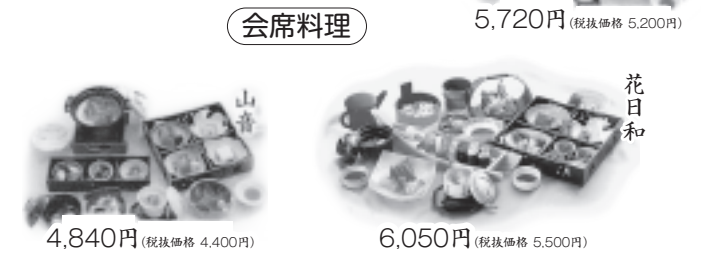
透明板で仕切った会食室 会席料理 5,720円(税抜価格 5,200円) 4,840円(税抜価格 4,400円) 6,050円(税抜価格 5,500円)