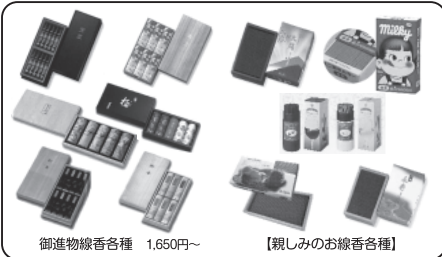
御進物線香各種 1,650円~