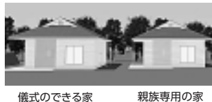
儀式のできる家 親族専用の家