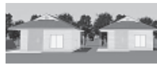
儀式のできる家 親族専用の家